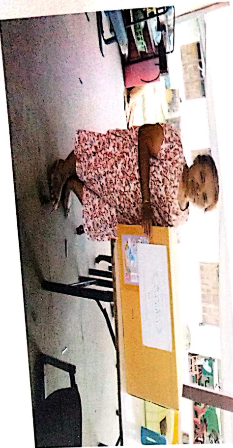
ภาพถ่ายตามโครงการสนับสนุนผู้สูงอายุ สำหรับบุคคลที่มีภาวะพึ่งพิง และบุคคลที่มีภาวะปัญญาการกลืนปีศาจหรือออทิสซึมไม่ได้ ประจำปีงบประมาณ พ.ศ. ๒๕๖๕