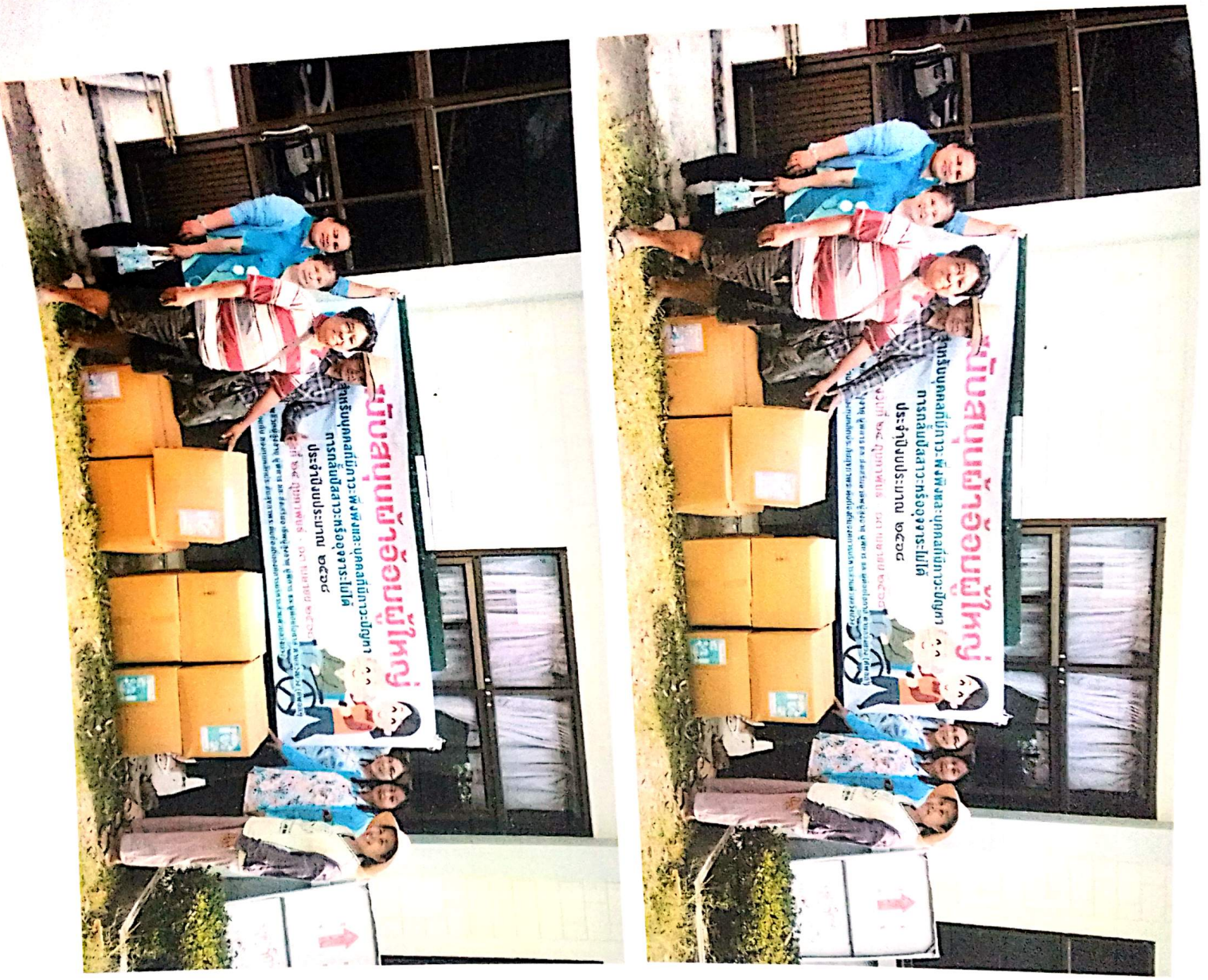
ภาพถ่ายตามโครงการสนับสนุนผ้าอ้อมผู้ใหญ่ สำหรับบุคคลที่มีภาวะพึ่งพิง และบุคคลที่มีภาวะปัญญาพิการกลับปัสสาวะหรืออุจจาระไม่ได้ ประจำปีงบประมาณ พ.ศ. ๒๕๖๘