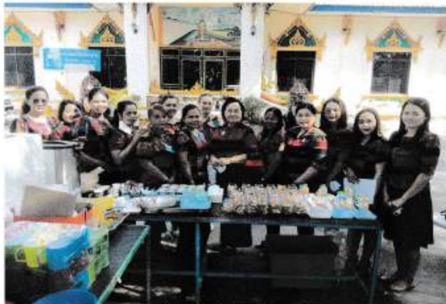
บ้านวังม่วง หมู่ที่ 1-2

ขอรับรองว่าเป็นภาพถ่ายโครงการ อบต.สัตตจร จัดเวทีประชาคมหมู่บ้าน/ตำบลเพื่อจัดทำแผนพัฒนาท้องถิ่น ระหว่างวันที่ 22 - 24 กุมภาพันธ์ 2566 จริง