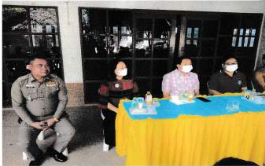
ท่านนายอำเภอเปี้ยน้อย ให้เกียรติร่วมโครงการ และ กล่าวพบประชาชน ม. 1,2

อบต.สัตตจร จัดเวทีประชาคมหมู่บ้าน/ตำบล เพื่อจัดทำแผนพัฒนาท้องถิ่น ประจำปีงบประมาณ พ.ศ. 2566