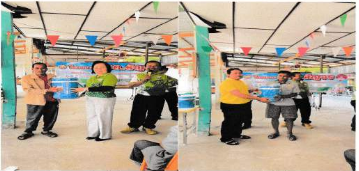
ท่านนายกพร้อมด้วยท่านสมาชิกสภา อบต.วังม่วง ม. 6 , 8 มอบของรวยให้ผู้ร่วมโครงการฯ