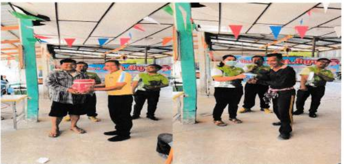
ขอรับรองว่าเป็นภาพถ่ายโครงการ อบต.สีญจรถัดเวที่ประชาคมหมู่บ้าน/ตำบลเพื่อจัดทำแผนพัฒนาท้องถิ่น ระหว่างวันที่ 22 - 24 กุมภาพันธ์ 2566 จริง