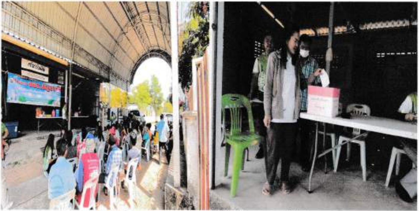
กล่องรับเรื่องราวร้องทุกข์ / เจ้าหน้าที่ป้องกันฯ สาธิตการใช้ถังดับเพลิง